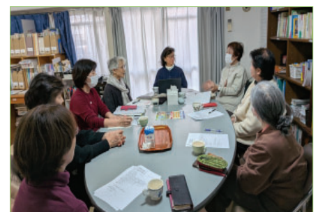
ある日の福祉部会

尚、国分寺ネットでは、生活クラブ運動グループ国分寺地域協議会と共に、広く市民から「ひとこと提案」として集めたものをまとめて、毎年、市に対して予算要望書を提出しています。福祉だけではなく、環境・教育・まちづくりなどについて70項目以上になります。国政では、企業の利権を優先する政策ばかりを次々に打ち出す政権が続いています。人々の生活に寄り添う施策への転換をめざして、協力しあって活動を続けましょう。